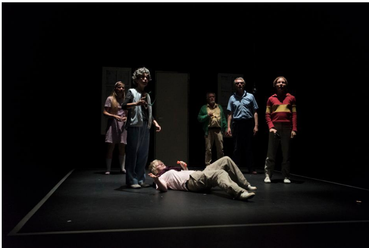
FROUSSE, photo Fred Hocké.

Pour ce premier spectacle nous avons été soutenu financièrement par la Région Normandie, le Conseil Départemental du Calvados, le CDN de Normandie-Rouen, et l'ODIA Normandie. Nous avons aussi eu le soutien (mise à disposition de salles de répétition) du Panta-Théâtre, de la Comédie de Caen, de l'Espace Rotonde/Cie Comédiamuse, et du Théâtre de Lisieux. Les Ateliers Intermédiaires et Le Labo des Arts à Caen, nous ont également soutenu pour des temps d'écriture, de construction, et de reprise de rôle.