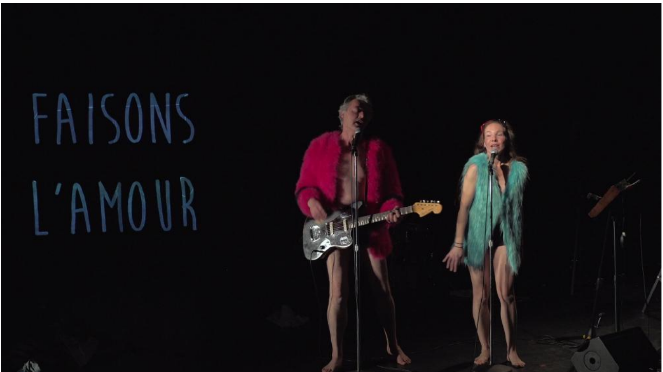
Répétitions, La Fabrique Chantenay, Nantes.

Dessiner-écrire, danser-bouger, chanter-parler : il s'agit de faire nos premiers pas d'Hommes et de Femmes, ensemble, sans rivalité, avec au contraire beaucoup de complicité et d'amusement, et tenter un geste de réécriture de notre Histoire.