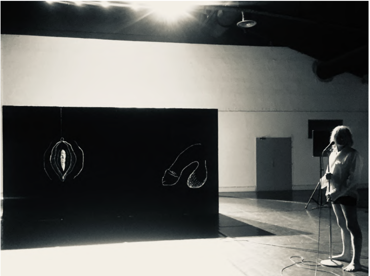
Répétitions, Halle aux Granges, Caen.