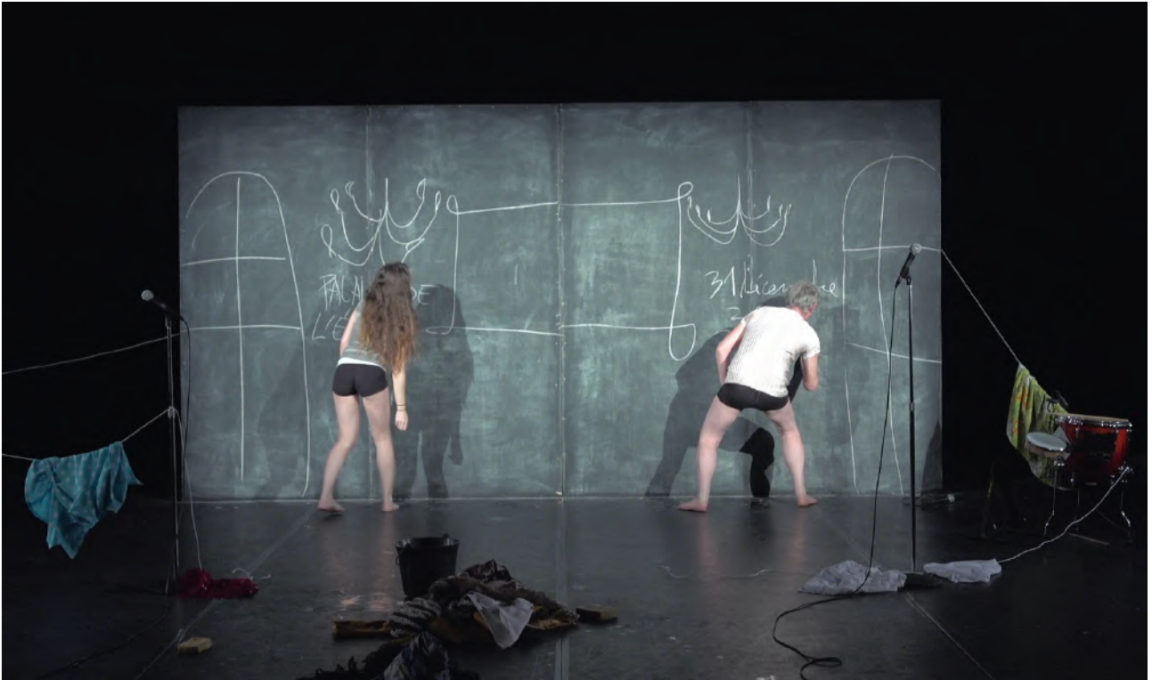
Répétitions, La Fabrique Chantenay, Nantes.