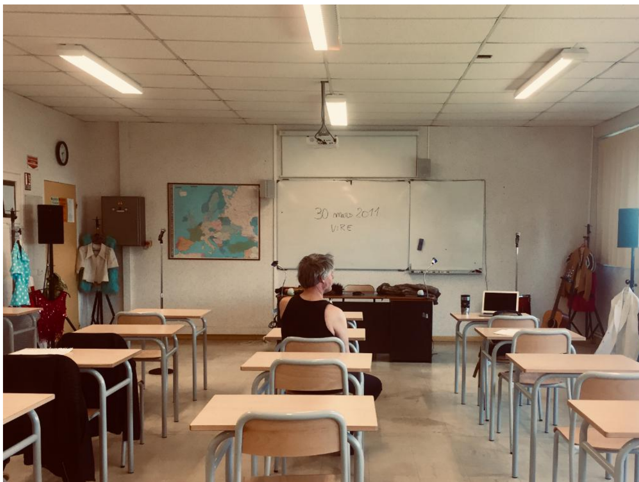
Répétitions, Lycée Mermoz, Vire.

Nous envisageons une discussion avec les élèves autour du spectacle et des sujets abordés après la représentation.