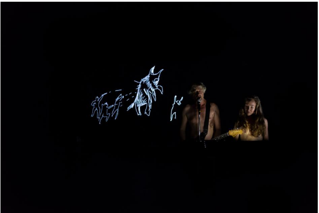
Larmes de crocodile

C'est d'abord l'écriture directe et sans fard de Virginie Despentes dans « King Kong théorie » qui nous a donné envie de questionner les codes du féminin et du masculin, mais ce sont les recherches anthropologiques de Françoise Héritier sur les origines de la hiérarchisation des sexes, et les BD étonnantes de Liv Strömquist qui nous ont mené vers ces personnages « premiers êtres humain et humaine » de l'histoire de l'humanité. Naïfs comme des enfants qui ont tout à découvrir, et en même temps complètement omniscients puisque ce sont aussi les derniers. Des personnages qui nous permettent donc une grande liberté pour questionner, réécrire, réinventer, rejouer l'histoire des femmes et des hommes, en interrogeant les codes, les normes, les habitudes, les acquis de notre Histoire fondée sur des millénaires de patriarcat.