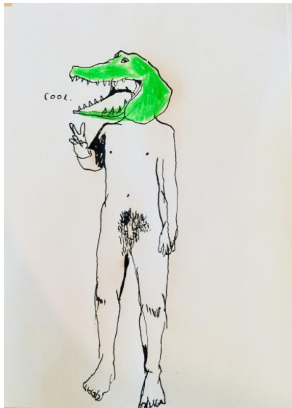
Dessin : Violaine de Maupeou

Grégoire Le Divelec (Bureau Hectores) / gregoire@hectores.fr / 06 18 29 30 61