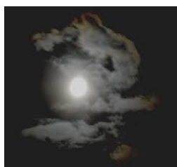
Clair obscur de lune

Les protagonistes des créations Bascule reprendront la parole en 2024, avec un texte destiné aux adolescents 11/16 ans, autour de la thématique de la rumeur (projet commande d'écriture – Aurélie Namur), des mots, des maux – titre du projet « Demos »