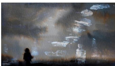
Histoire de fantômes –

Il collabore sur 2028 et 2019 à l'écriture/mise en scène pour des projets jeune public avec des compagnie de danse hip hop : cie Tensei(Ferney Voltaire) - Cie Shamploo(Genève).