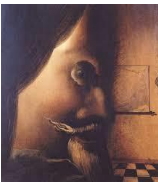
L'image disparaît – Dali