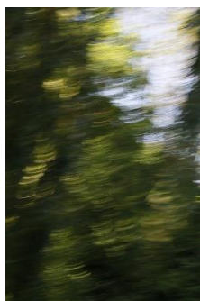
Illusion du mouvement