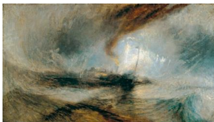
Zone d'ombre et de lumière – William Turner. Un bateau au loin ? une cathédrale à la dérive ?