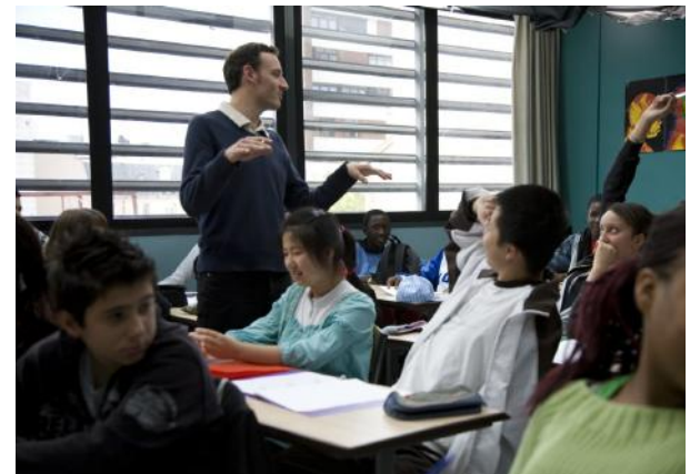
© Entre les murs, Laurent Cantet